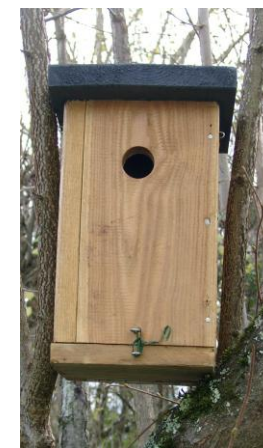
Nichoir à orifice circulaire